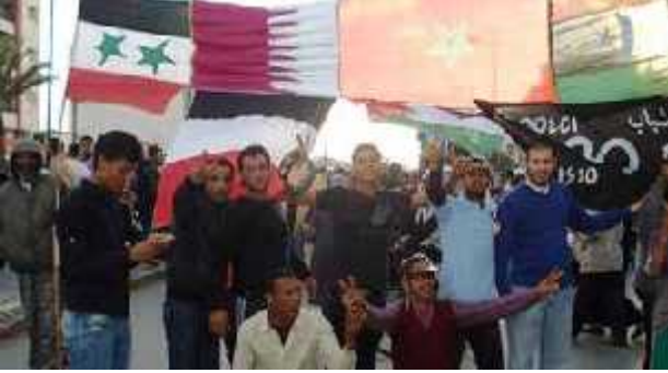
مسيرة أعضاء من حركة 20 فبراير الشبابية المغربية للمطالبة بالإص