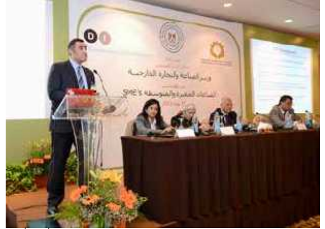
الصغيرة والمتوسطة تركز على الضغط من أجل تأسيس هيئة عامة لتنمية الصناعات الصغيرة والمتوسطة، في يونيو 2013

عبر وحدة الدعم الفني للصناعات الصغيرة والمتوسطة، أصبحت غرفة صناعة الأردن رائدة إقليمياً ومثالاً تشجيعياً لكيفية دعم الصناعات الصغيرة والمتوسطة.