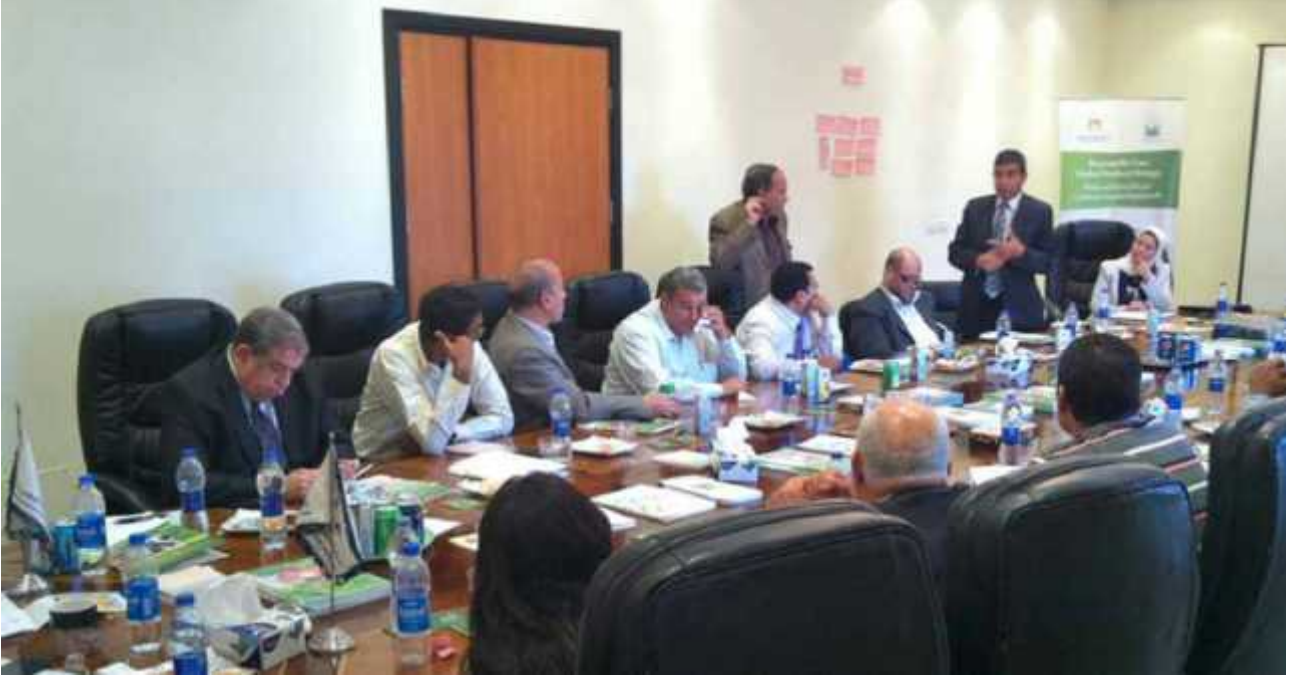
الحوار الاجتماعي مهم حيث يساهم في حكم رشيد وسوق عمل

في كثير من الحالات، وتم استبدالهم بشباب زبائني. ومع ذلك، تفتقر المؤسسات إلى المعرفة اللازمة للقيادة بطريقة ديمقراطية، كما أنها غير معتادة على التصرف مستقلة بتفويض من أعضائها فقط.