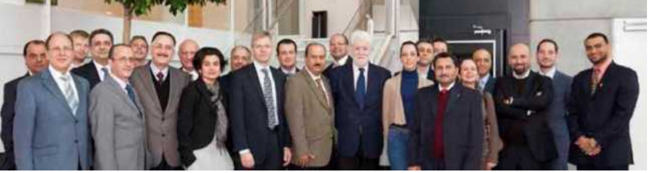
تحت مسمى شبكة تسهيل الأعمال العربية الأوروبية