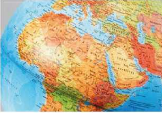
ب منظمات عضوية الأعمال دورا حاسما في بناء بيئة عمل أكثر تمكينا